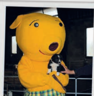
VI HILSER OGSÅ LIGE PÅ DE SMÅ BLØ- DE HUNDEHVALPE.