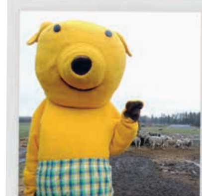
SE ALLE DE SØDE FÅR.