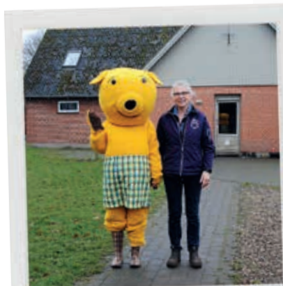
HEJ ÅSE! ER DU EN HYRDE?