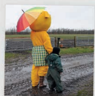
FÅRENE BEHØVER INGEN PARAPLY, DE HAR EN TYK PELS.