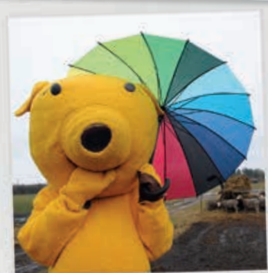
NU REGNER DET. GODT JEG HAR MIN PARAPLY.