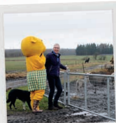
SE, DE BOR PÅ MAR- KEN. VI SKAL HUSKE AT LUKKE LÅGEN.