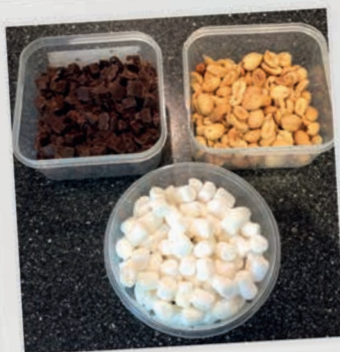
HER ER HVAD DU SKAL BRUGE