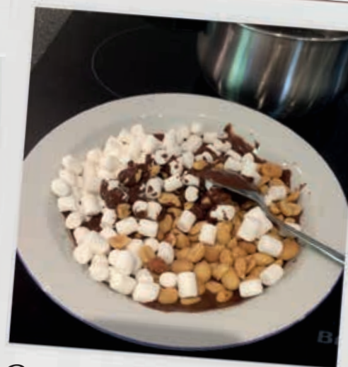
RØR SKUMFIDUSER OG PEANUTS I