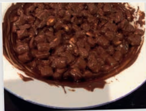
LAV SMÅ KUGLER PÅ ET STYKKE BAGEPAPIR