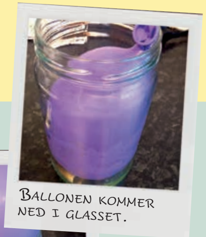
BALLONEN KOMMER NED I GLASSET.