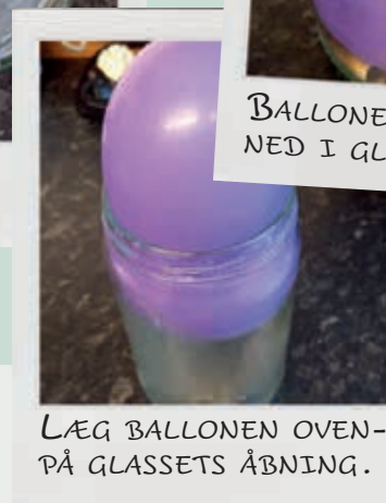
LÆG BALLONEN OVENPÅ GLASSETS ÅBNING.

For Gud er alt muligt Selvom det i første omgang kan virke umuligt at få ballonen ned i glasset, kan det godt lade sig gøre med lidt hjælp og