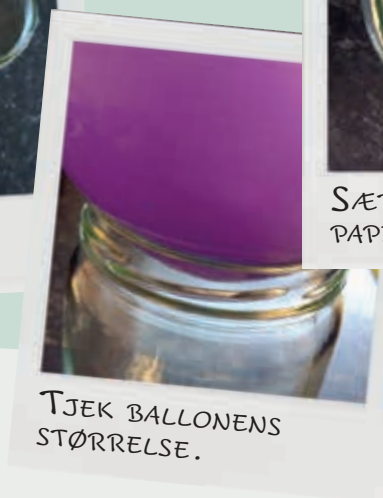
TJEK BALLONENS STØRRELSE.