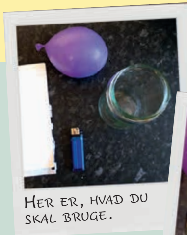
HER ER, HVAD DU SKAL BRUGE.