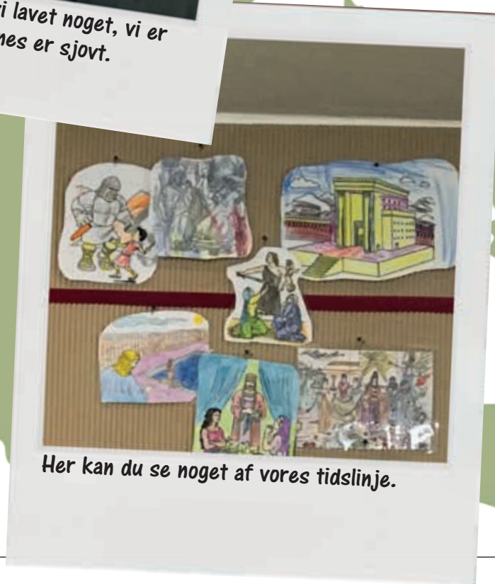
Her kan du se noget af vores tidslinje.