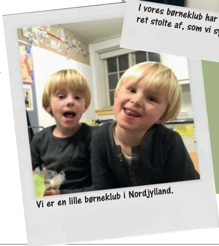
Vi er en lille børneklub i Nordjylland.

Vi er en lille børneklub i Nordjylland, og vi har lavet noget, vi er ret stolte af, som vi synes er sjovt. Det er en lang tidslinje, der fylder en hel væg. Tidslinjen begynder med tegninger fra begyndelsen af Bibelen: Adam og Eva - og i den anden ende er der nogle tegninger fra historierne i Det Nye Testamente. Der er også et stort år nul på linjen - der har vi selvfølgelig billeder fra jul, da Jesus blev født. Tidslinjen er ikke færdig, for en gang i mellem, laver vi nye tegninger, laminerer dem og sætter dem på tidslinjen. På billederne kan du se vores tidslinje - og os.