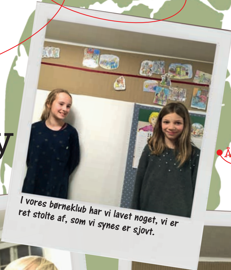
I vores børneklub har vi lavet noget, vi er ret stolte af, som vi synes er sjovt.